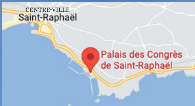
Plan d'accès - Palais des Congrès

e.mail : lesjournéesraphaeloises@wanadoo.fr